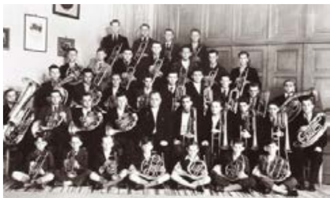
Oddělení žesťových dechových nástrojů Blechbläser-Abteilung