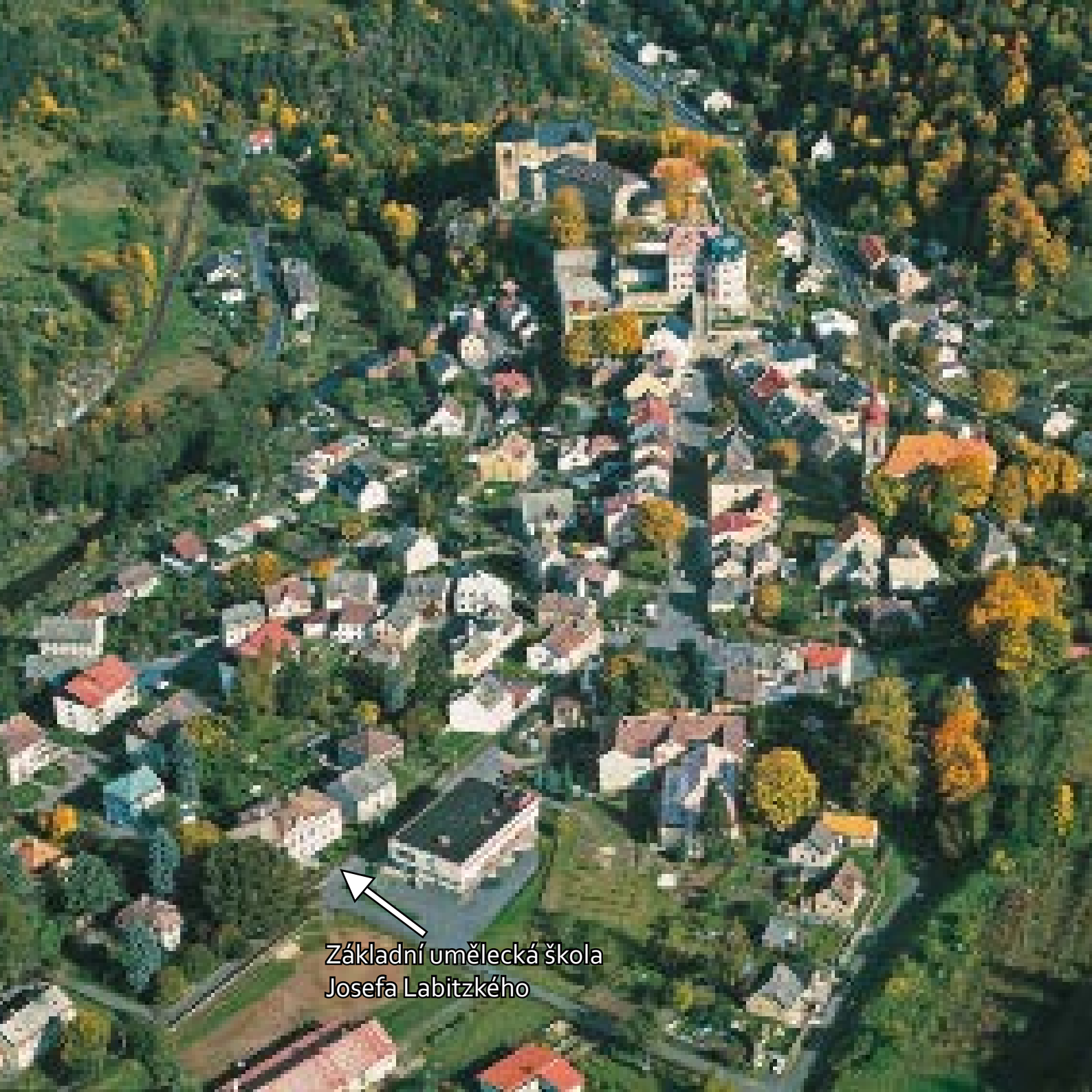
Základní umělecká škola Josefa Labitzkého