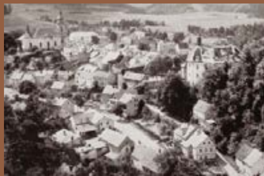
Výhled z Janova kamene na město s kostelem, školou a zámkem Blick vom Johannes-Stein zur Stadt mit Kirche, Schule und Schloss