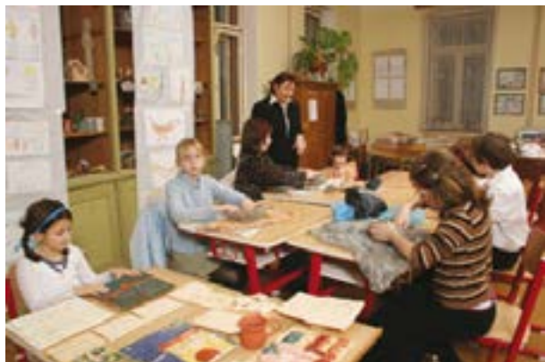
Oddělení výtvarného oboru Abteilung der Bildened Kunst