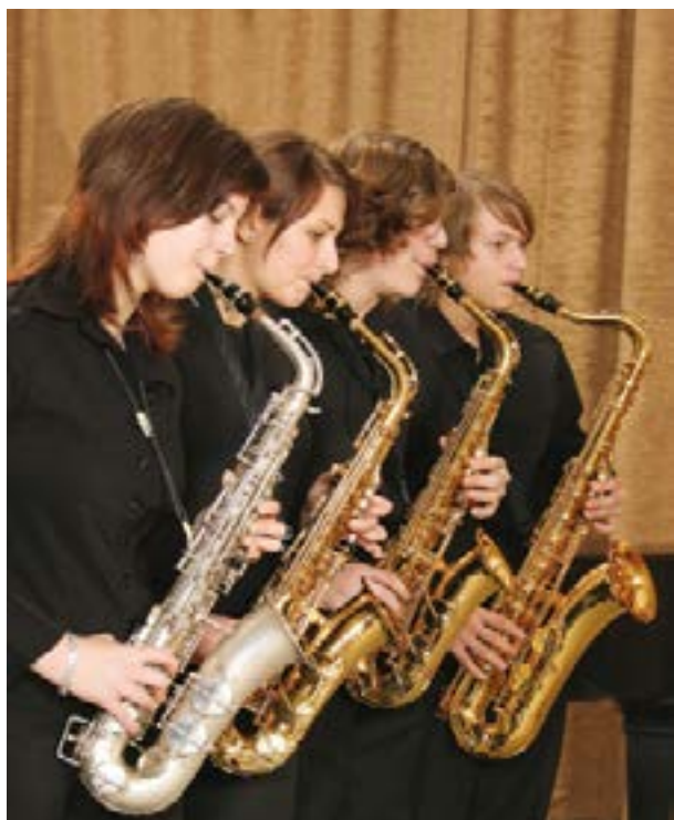
Saxofonový kvartet Saxophon-Quartett