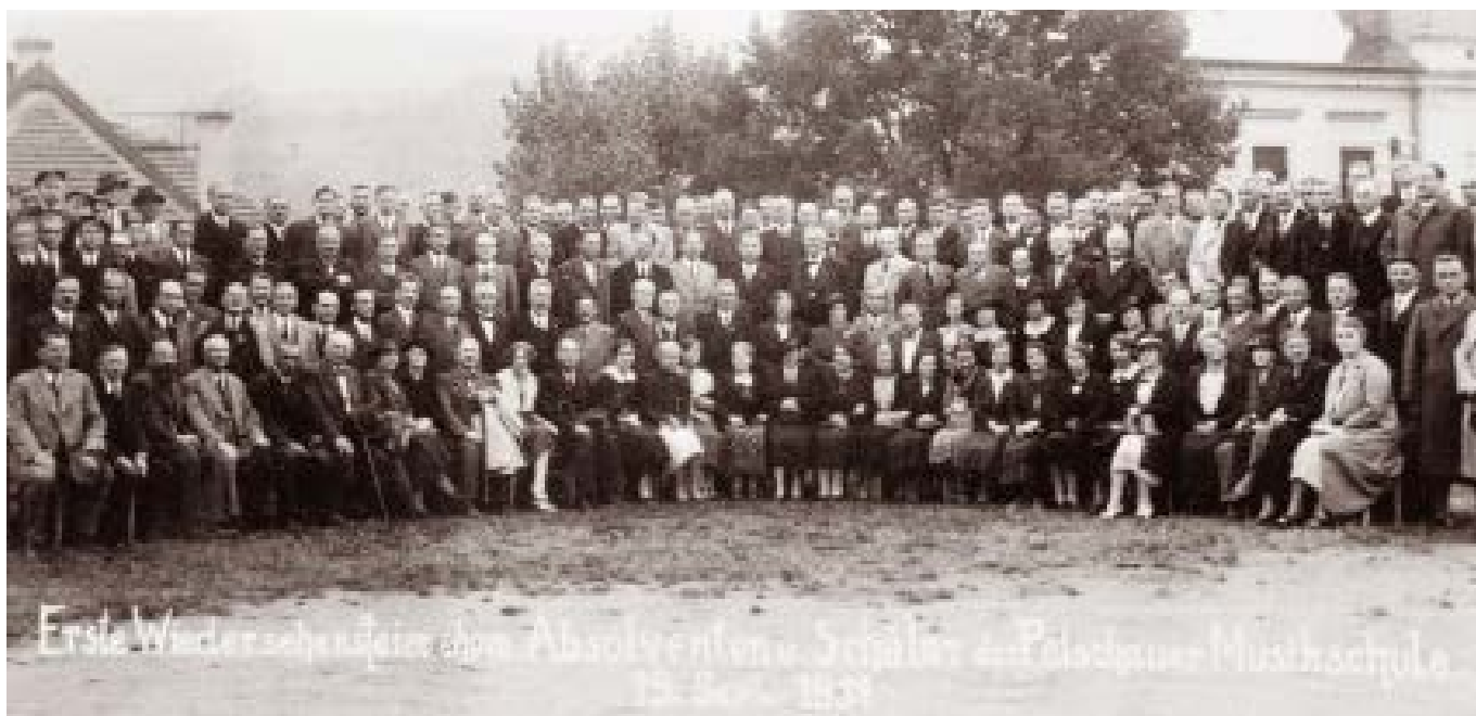
Setkání bývalých absolventů hudební školy v Bečově 19. září 1937 Treffen der ehemaligen Absolventen der Musikschule Petschau am 19. September 1937