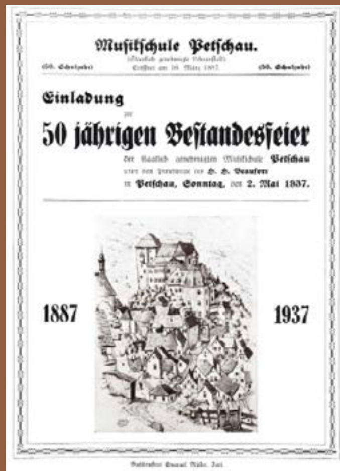
Pozvánka k oslavě 50-ti let existence hudební školy v Bečově pod patronací panovnického rodu Beaufort-Spontin. Einladung zur Feier 50. Jahre Existenz der Musikschule Pötschau unter der Schirmherrschaft der Beaufort-Spontin.